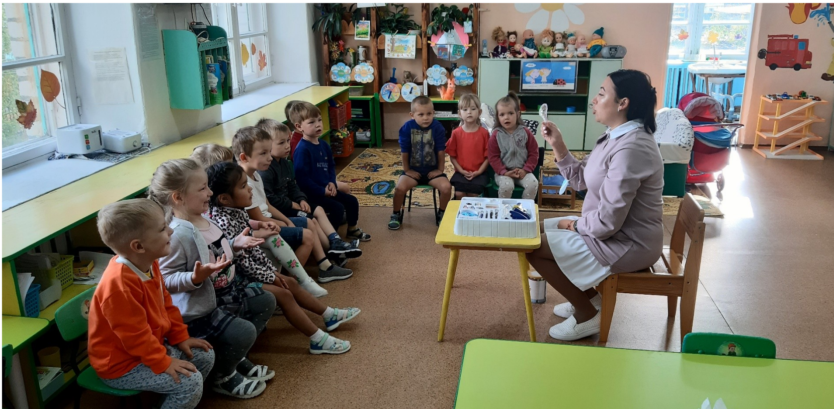
Фото отчёт по опытно – экспериментальной деятельности.