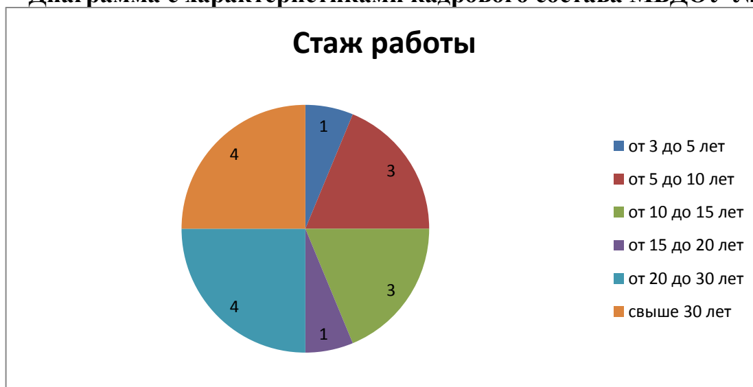
Диаграмма с характеристиками кадрового состава МБДОУ № 27