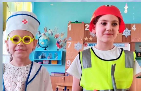
Подготовительная к школе гр№6