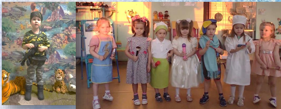
2 младшая гр.№3