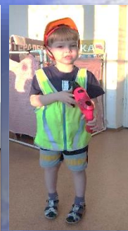
Средняя гр. №4