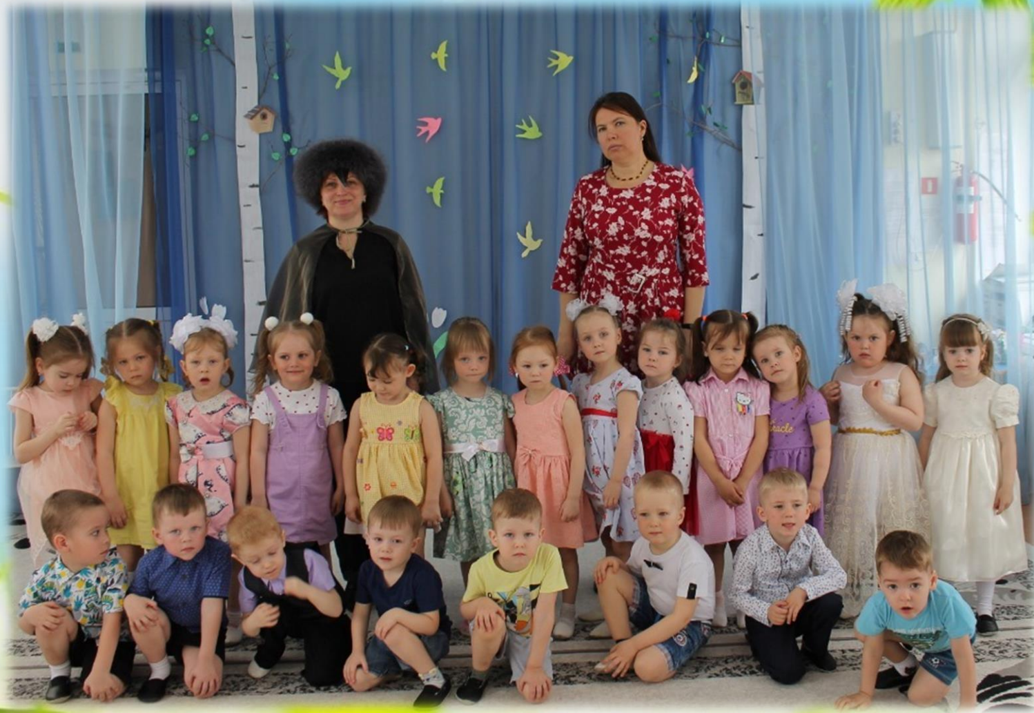
Весенний праздник во второй младшей группе «Птицы-наши лучшие друзья»