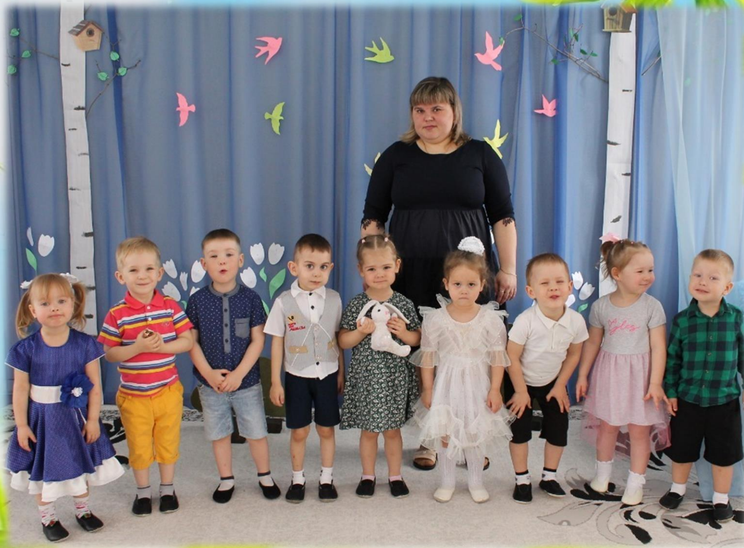
Весенний праздник в первой младшей группе «Весенняя прогулка»