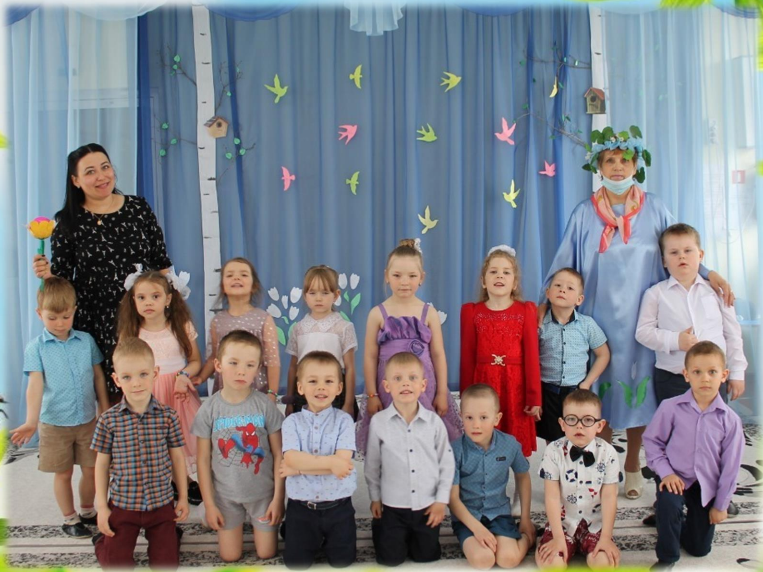
Весенний праздник в средней группе «Мы идем искать весну»